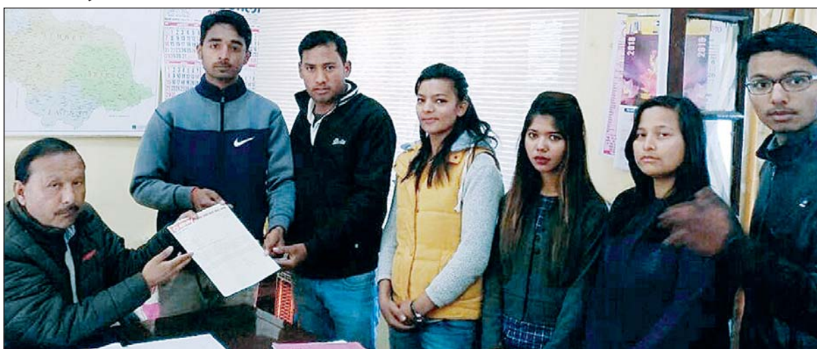
ज्ञापन सौंपते छात्र-छात्राएं।

गुरुवार को कुमाऊं विश्वविद्यालय द्वारा पीएचडी प्रवेश परीक्षा के शुल्क में एक हजार रुपये की वृद्धि से नाराज एबीवीपी ने जिलाधिकारी के माध्यम से उच्च शिक्षा मंत्री धन सिंह रावत को ज्ञापन भेज शुल्क वृद्धि को छात्र हित में शीघ्र वापस लिए जाने की मांग उठाई। उन्होंने कहा कि पहले ही