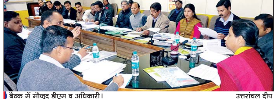
बैठक में मौजूद डीएम व अधिकारी।