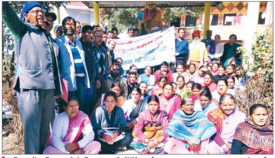
पालिका में शामिल करने के खिलाफ धरने में बैठे ग्रामीण।

चेतावनी देते हुए कहा कि यदि अधिसूचना निरस्त नहीं की गई तो आगामी नगर निकाय और लोकसभा चुनावों का बहिष्कार किया जायेगा। गुरुवार को ग्राम संघर्ष समिति के बैनर तले पालिका परिसीमन में मिलाए गए सभी 13 ग्राम पंचायतों के ग्रामीण चौघानपाटा गांधी पार्क में