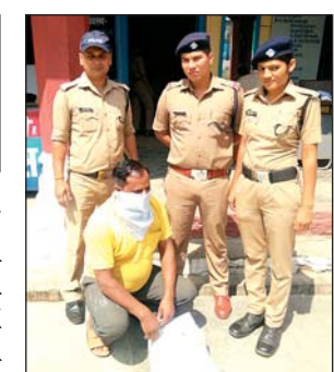
आबकारी एक्ट में मुकदमा पंजीकृत कर रोडवेज की बस को सीज कर दिया है।