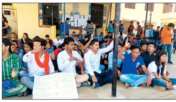
एएसएस जिला परिसर अल्मोड़ा में नारेबाजी करते एबीवीपी कार्यकर्ता, रानीखेत में पुतला दहन करते छात्र