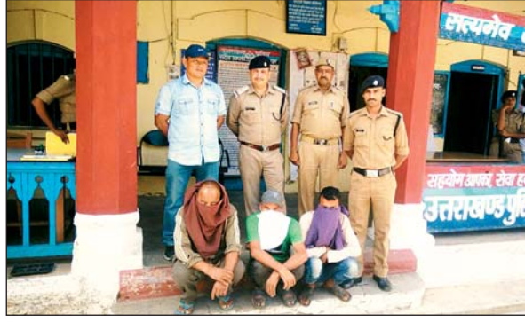
पुलिस हिरासत में ट्रक चालक

संवाददाता @ dainikuttaranchaldeep.com अल्मोड़ा। एक तरफ रसोई गैस का अधोपित संकट चल रहा है, वहीं दूसरी ओर कालाबाजारी भी जमकर रही है। बुधवार को यहां लोथिया बैरियर पर तलाशी के दौरान हल्द्वानी से अल्मोड़ा आ रहे गैस के तीन ट्रकों में 55 खाली सिलेंडर बरामद हुए। इससे घरेलू गैस की कालाबाजारी की पुष्टि हुई। पुलिस ने इस मामले में तीन ट्रक चालकों खिलाफ मुकदमा पंजीकृत कर दिया है।